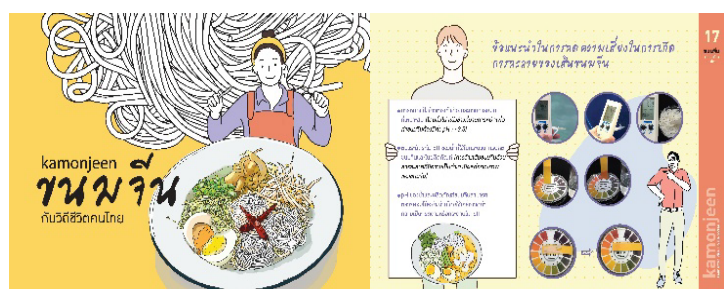
図3 液状化の抑制方法等をタイ語で紹介する小冊子