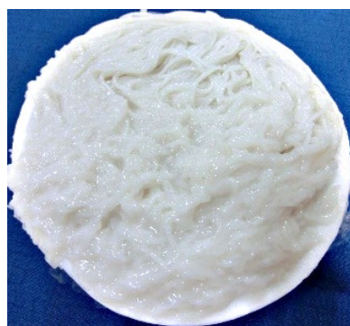
図1 販売前に液状化が発生し、市場から回収された発酵型米麺

発酵型米麺の液状化抑制技術に加え、製法や調理法を現地語で平易に解説するタイ語の小冊子(図3)は、製麺業者の収益向上、食品ロスの軽減、食育の推進に利用されている。