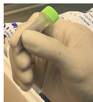
病変部組織をすり潰す