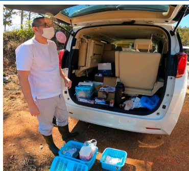
図2 持ち運び可能な必要物品一式を現場に持ち込んで迅速な診断を行う