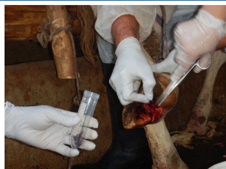
農場で病変部組織を採材