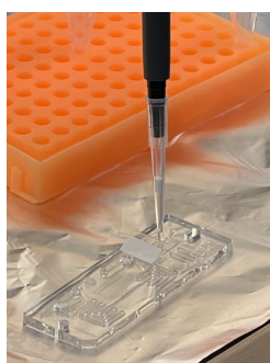
処理した病変部組織と反応試薬を混ぜて測定チップに装填する