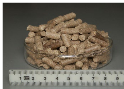
図4 「JES1」を原料とするペレット燃料