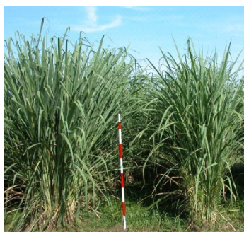
図1 エリアンサス品種「JES1」の草姿(熊本県合志市)

同様なエリアンサスの育種やペレット利用は、バイオマス作物の利用を検討している他のアジア地域にも適用できる。