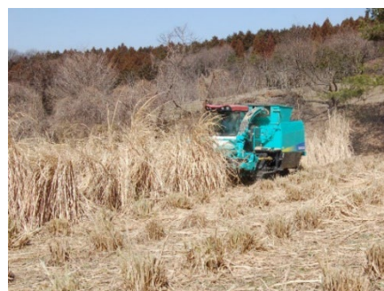
図2 飼料用収穫機での収穫