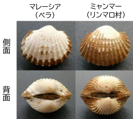
図1 ハイガイ( Tegillarca granosa )

アカガイの近縁種であるハイガイ( Tegillarca granosa ) (図1)はミネラル・ビタミン等を多く含み、東南アジアの人々の栄養バランスの観点からも非常に重要な水産資源である。しかし近年は沿岸環境の悪化に伴って生産量が激減しており、資源回復への対策と適正な資源管理が求められている。そこで、二枚貝の成育環境の指標となる丸型指数と肥満度を、貝を生かしたまま簡単に計測できるように改良し、ハイガイの漁場環境と成育状態を迅速に評価する手法を開発した(図2)。この手法では、殻長・殻幅・全重量の3変数を計測するだけで指標が計算できるため、養殖漁場の環境モニタリングや成育状態の把握が容易になる。これにより、優れた養殖漁場の選定(図3)や適切な収穫時期の把握が可能となり、科学的根拠に基づく資源管理が実現する。