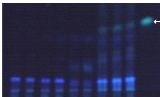
図2 薄層クロマトグラフィーによるラミン材の判別 サクラネチンの検出によってラミンであることが特定できる。 1-6: 類似の樹種 7-9: ラミン( Gonystylus banacanus ) 10: サクラネチン(sakuranetin)標品