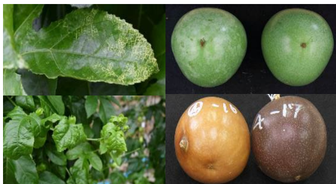
図1 パッションフルーツの葉や果実におけるウイルス様症状

原因不明のウイルス様症状についても本方法で症状が解消される場合があり、国内外のPLV以外のウイルスにも有効と考えられる。