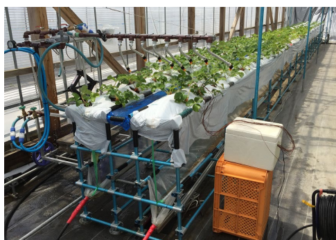
図1 温湯散布装置(岩手県陸前高田市)