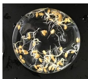
事前乾燥処理なし (水分含量14.0%)

この消毒法は、種籾を乾燥でき、湯を沸かす環境があれば、特別な装置を必要としない技術である。タイ(図3)やマレーシアの栽培品種を用いた試験では、事前乾燥処理により種子に高温耐性向上の効果があることが示されている。東南アジアの米作地帯での実用化も十分に期待できる。