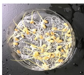
事前乾燥処理あり (水分含量8.9%)