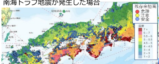
地震発生時の危険度予測