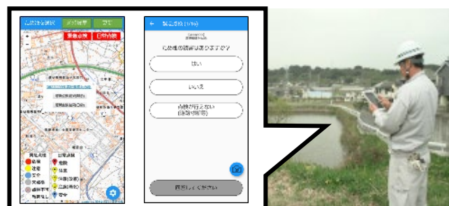
図2 ため池管理アプリ