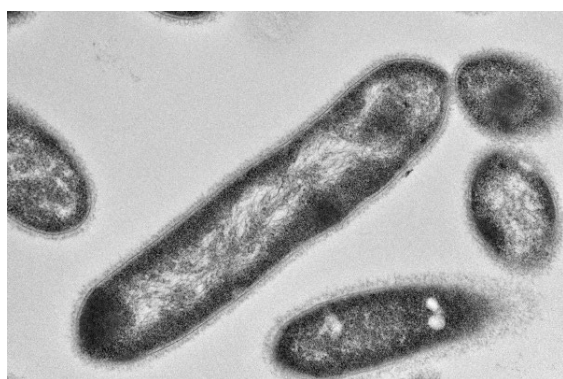
図1 糖化菌の電子顕微鏡写真

食品・農業生産により副次的に生じる膨大な量の農業残渣は、自然界での分解が難しく、未利用のまま放置・廃棄・焼却によってGHGの発生源となっている。「微生物糖化法」(図2)は酵素を一切使わず、微生物のみで農業残渣を糖化・可溶化できる新しい糖化法である。その「微生物糖化法」により、固体である農業残渣は分解・液化され、糖質や有機酸となり、バイオガスやバイオ水素へ効率的に変換することができる。さらに、微生物糖化で発生するCO 2 とバイオ水素をメタン発酵槽へ戻し、メタン発酵プロセスを組み合わせたバイオメタネーションを行うことで、未利用の農業残渣からのエネルギー生産や再資源化、加工過程でのGHGゼロエミッション化が可能となる。