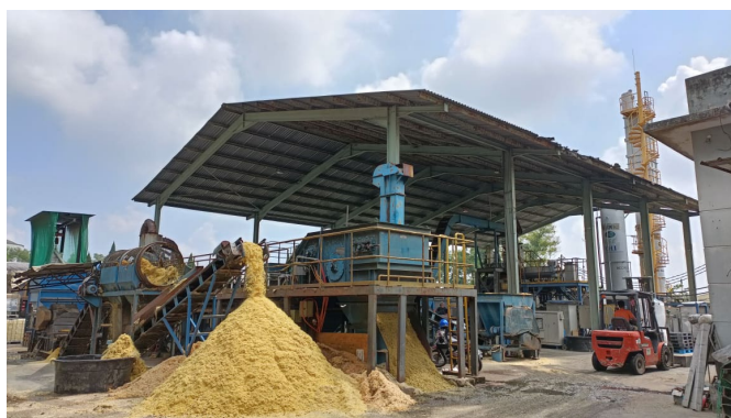
図3 マレーシアジョホール州クルアンにある実証設備。廃液などは糖質回収、バイオガス製造、液肥化を行い、多種多様(カスケード)な利用を行うゼロエミ型プロセスである。