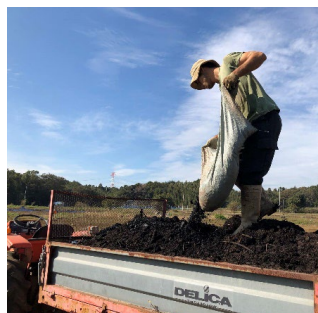
図1 (左)簡易炭化器でつくられたバイオ炭(竹) (右)バイオ炭を堆肥と混ぜて畑に施用