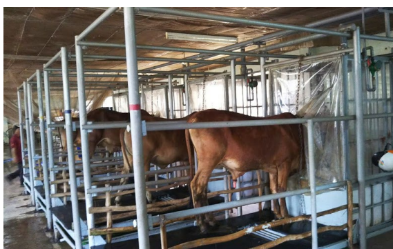
図1 ベトナム在来牛(ライシン牛)とメタン排出量測定の様子

ライシン牛は熱帯地域で広く飼養されるゼブー牛( Bos indicus )の一種であることから、本技術は他の地域においても、ゼブー牛を対象に広く活用できる可能性がある。